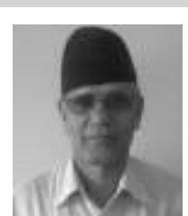
● क. वसन्त ●

विश्व बैंकले २०१९को सुरुमै एउटै प्रकृतिका दुईवटा महत्वपूर्ण पुस्तकहरू प्रकाशन गरेको छ । ती दुई पुस्तकहरू मध्ये एउटा विश्व विकास प्रतिवेदन २०१९ (World Development Report 2019) र अर्को वैश्विक आर्थिक संभावनाहरू २०१९ (Global Economic Prospects 2019) शीर्षकमा प्रकाशित भएका छन् । दुवै पुस्तकले विज्ञानको पछिल्लो विकास अर्थात स्वचालन र कृत्रिम प्रज्ञालाई आफ्नो विश्लेषणको मूल आधार बनाएका छन् । नाम अनुसार नै पहिलो पुस्तकले प्रविधि-