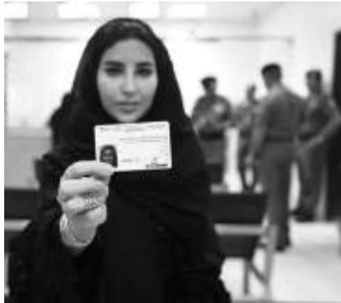
गरिरहेको छ ।

सरकारका अनुसार देशभर यस्ता २०० लाइसेन्सहरू स्वदेशी बनाइँदै छन् । यो प्रक्रिया एक साता पनि लामो छैन । साउदी सरकारले लाइसेन्स लिने महिलाहरूलाई प्रोत्साहित