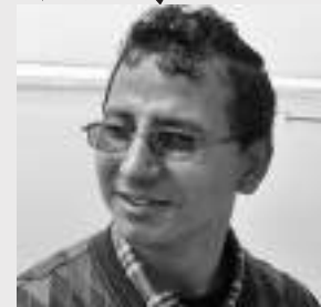
● हिरामणि दुःखी ●

त्यो रात निष्पट रात निर्धिनी रात अभिशाप्त रात अर्थात् तेह जेठको रात ।