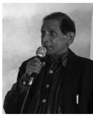
माओवादी आन्दोलनमा ल्याउन प्रतिक्रियावाद र संशोधनवाद/अवसरवादको व्यापक रूपमा भण्डारण गर्नुपर्ने विषयमा जोड दिए । कतिपय अवस्थामा प्रतिक्रियावाद

काठमाडौं । नेकपा (क्रान्तिकारी माओवादी)का अध्यक्ष मोहन वैद्य किरणले अखिल नेपाल जनसंस्कृतिक महासंघको राष्ट्रिय भेलालाई सम्बोधन गर्दै भारतले नेपालका राजनीतिक पार्टीहरू कसैलाई चुनाव गराउ र कसैलाई चुनाव बहिस्कार गर भनेर द्वेष नीति लिइरहेको दावी गरेका छन् । महासंघको शुक्रबार घट्टेकुलोस्थित इन्द्रक सौंस्कृतिक प्रतिष्ठानको सभाहलामा राष्ट्रिय भेलाको उद्घाटन गर्दै अध्यक्ष किरणले यस्तो दावी गरेका हुन् ।