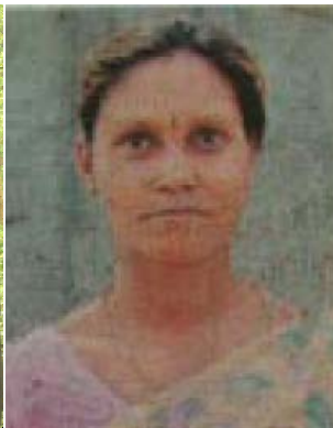
కా. సారక్క (అనిత, పి.ఎం.)