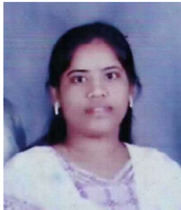
కా. యాశుభ్ ఠి (సోని)డి.సి.ఎం.