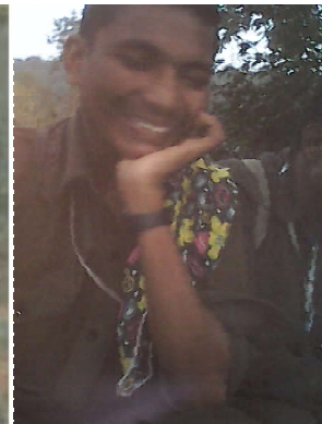
కా. ఛైతు (రోషన్, పి.ఎం.)