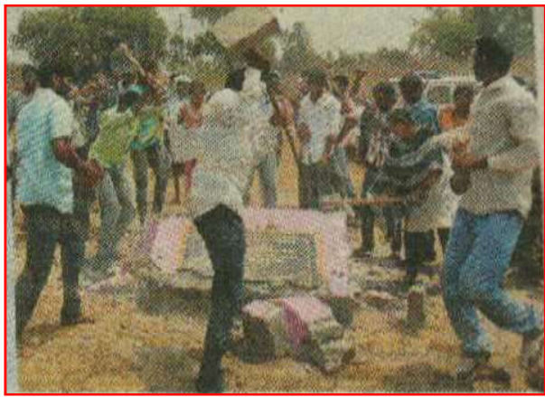
ఓపెన్ కాస్ట్ శిలాఫలకాన్ని ధ్వంసం చేస్తున్న గ్రామస్థులు

ధర్మారం, గొండుగూడ, అచ్చుతరావు తండా, పెద్దనపల్లి (ఎస్) ప్రజలు పెద్ద ఎత్తున కదిలి మా గ్రామాలను కనుమరుగు చేసి బొందలగడ్డలుగా మార్చి వారి బతుకులను నాశనం చేసే కళ్యాణిఖని మెగా ఓపెన్ కాస్ట్ ను తవ్వకుండా సింగరేణి యాజమాన్యాన్ని అడ్డుకున్నారు. టీ.ఆర్.ఎస్. ప్రభుత్వం ప్రజల జీవించే హక్కును కాలరాస్తూ సింగరేణి యాజమాన్యానికి అండగా వుండి ఓపెన్ కాస్ట్ లకు వ్యతిరేకంగా పోరాడుతున్న ప్రజలపై పోలీసులతో దాడులు చేయిస్తున్నది. కళ్యాణిఖని మెగా ఓపెన్ కాస్ట్ అయ్యే ప్రాంతం ఏజెన్సీ ప్రాంతం, 1/70 చట్టం, 5వ షెడ్యూల్ కిందకు వస్తాయి. ఈ ప్రాంతంలో ప్రాజెక్టులు నిర్మించాలంటే పెసా చట్టం ప్రకారం గ్రామ సభలు నిర్వహించాలి. ఈ చట్టాలను తుంగలో తొక్కి సింగరేణి యాజమాన్యం టీ.ఆర్.ఎస్. ప్రభుత్వం అండతో పోలీసుల పశుబలంతో ఓపెన్ కాస్ట్ లు తవ్వతుంటే నిర్వాసిత ప్రజలు కదిలి శిలాఫలకాలను ధ్వంసం చేసి సింగరేణి యాజమాన్యాన్ని తరిమికొట్టారు.