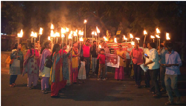
రాజకీయ ఖైదీల విడుదల కొరకు కాగడాల ప్రదర్శన

భగత్ సింగ్, రాజగురు, సుఖదేవ్ ల సంస్మరణలో మార్చి 23 నుండి 29 వరకు రాజకీయ ఖైదీల హక్కుల వారంలో భాగంగా మార్చి 27న వరంగల్ జిల్లా హన్మకొండలోని అంబేద్కర్ భవన్ లో రాజకీయ ఖైదీల విడుదల కమిటీ బహిరంగసభ నిర్వహించింది. ఉరిశిక్షలను రద్దు చేయాలని, ఆపరేషన్ గ్రీన్ హాంట్ దాడిని వెంటనే నిలిపి వేయాలని, యు.ఎ.పీ.ఎ., ఎ.ఎఫ్.ఎస్.పీ.ఎ. వంటి కృర నిర్బంధ చట్టాలను ఎత్తి వేయాలని, రాజకీయ ఖైదీలను బేషరతుగా విడుదల చేయాలని, ఐ.పీ.సీ. నుండి రాజద్రోహ నేరాన్ని తొలగించాలని వక్రలు డిమాండ్ చేశారు.