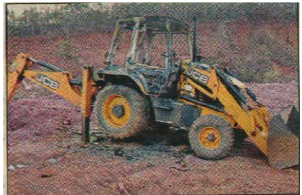
దహనం చేసిన ఎక్స్ కవేటర్

గనుల తవ్వకం, ఓపెన్ క్యాస్టలతో ప్రజలను నిర్వాసితులను చేయటాన్ని వ్యతిరేకిస్తూ మే 4, 5 తేదీలలో బండు పాటించాలని కోరుతూ వరంగల్ జిల్లా ములుగు మండలం మల్లంపల్లి గ్రామ శివారులోని ఎర్రమట్టి క్వారీలోని ఎక్స్ కవేటర్ ను మే 3న దళం తగులబెట్టింది.