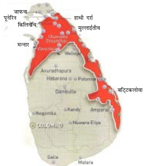
तमिल ईलम का इलाका

राष्ट्रीयताओं को गहरा सदमा लगा, तो वहीं दूसरी ओर दुनिया भर में लुटेरे वर्गों ने जश्न मनाया। 20 मई को श्रीलंका की सिंहली अंधराष्ट्रवादी सरकार ने राष्ट्रीय अवकाश की घोषणा की ताकि 'जीत का जश्न' मनाया जा सके। पूरी दुनिया में इस घटना की प्रतिक्रिया में विरोध प्रदर्शन किए गए। लाखों तमिलों ने अपने प्यारे नेता प्रभाकरण को श्रद्धांजली दी। यह निश्चित रूप से कहा जा सकता है कि श्रीलंका की सरकार ने एलटीटीई पर निर्णायक जीत हासिल की। दुनिया के शक्तिशाली गुरिल्ला संगठनों में से एक एलटीटीई को पराजय क्यों झेलनी पड़ी? श्रीलंकाई सेना उसे कैसे हरा सकी? क्या इस पराजय से आत्मनिर्णय के अधिकार के लिए पिछले साढ़े तीन दशकों से जारी सशस्त्र संघर्ष का अंत हो गया? क्या श्रीलंकाई सरकार ईलम जनता की न्यायसम्मत राष्ट्रीय आकांक्षाओं की पूर्ति कर सकेगी? श्रीलंका के तमिल सिंहली लोगों के बराबर नागरिकों