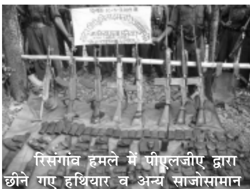
रिसगांव हमले में पीएलजीए द्वारा छीने गए हथियार व अन्य साजोसामान

यह हमला तब हुआ जब कांकर की पुलिस पार्टी चार वहांनों के काफिले में सवार होकर फरसगांव खल्लारी ग्रामों की सर्चिंग कर वापस नगरी की ओर आ रही थी। मांदागिरी एवं संदाबाहरा गांवों के बीच पहाड़ी पर पीएलजीए के लाल योद्धा घात लगाए बैठे थे। पीएलजीए ने बारूदी सुरंग का विस्फोट किया जिस कारण टाटा 407 वाहन तथा एक टाटा सुमो वाहन उसकी जद में आ गए और उनके परखचे उड़ गए। हमला पांच बजे शुरू हुआ और रात होने तक चलता रहा। इस जबरदस्त हमले से पुलिस वालों में हड़कंप मच गया जिसके बाद वे जंगलों की तरफ भाग