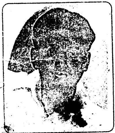
కా వెంకటాద్రి సత్యం

నక్సలైట్ల 30వ వార్షికాత్మవాసికి విజ్ఞప్తి పుస్తకాలు !!