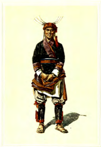
瑶 族 (YAO)