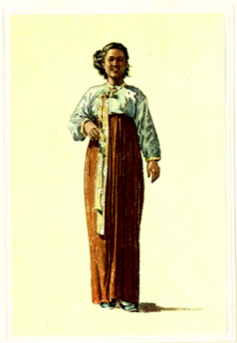
新 裝 畫