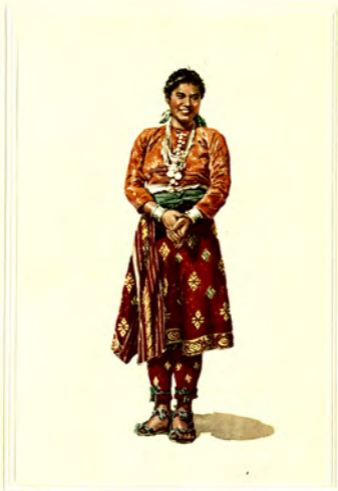
李 氏 氏