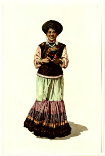
图 5 (1914年)