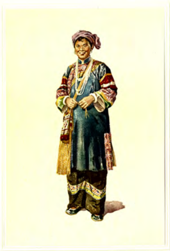
拉 彝 族