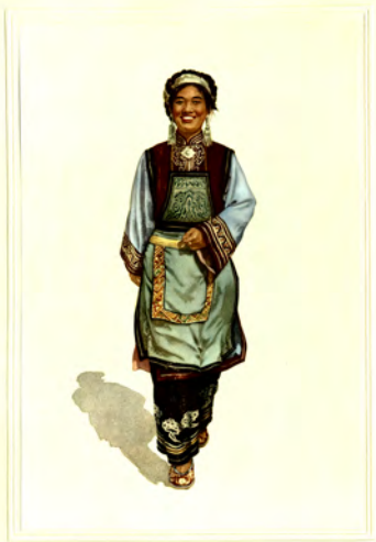
★ 京 (60/784)