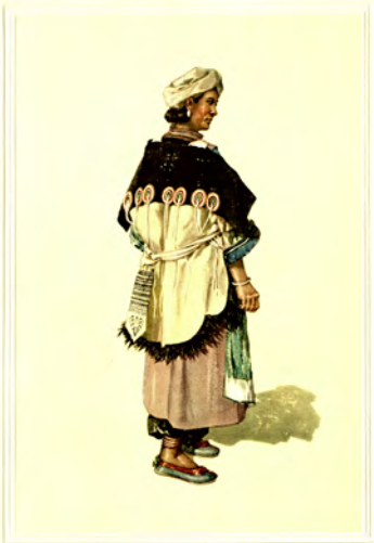
裝 西 裝