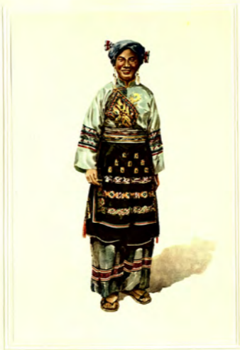
瑶 族 (YAO)